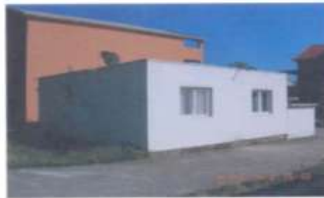
Sl. 3, 5i 6. stari objekat koji je goreo