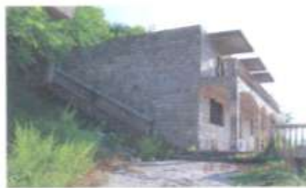
Sl. 1 i 2. solidne nezavršene porodične kuće u Zelenici